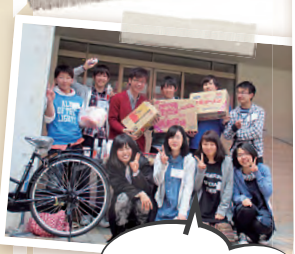
新生活グッズ 買ったちゃいました