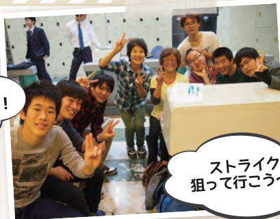
ストライク 狙って行こう~!