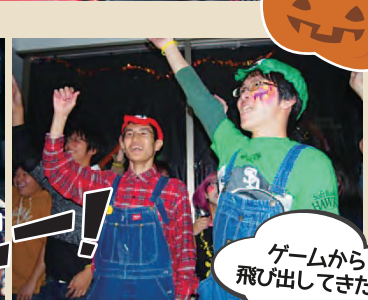
ゲームから飛び出てきた?