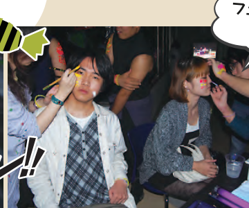
フェイスペイント 体験中!