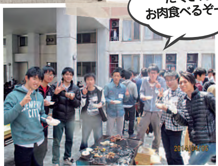
たくさん お肉食べるぞー!