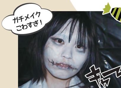
ガキメイク こわすぎ!