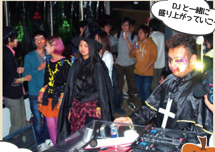
DJと一緒に盛り上げていこー

セトル伊都 4階ラウンジに暗幕を貼って、学生主催で行われたハロウィンパーティ! DJブース、パフォーマンスステージ、フェイスペインティングコーナーまである本格的なパーティ。まわりを見渡せばゾンビ、パンダ、有名ゲームのキャラクター達など、みんな思い思いの仮装をして楽しんでいるではありませんか! ステージでは九大のアカペラサークル“ハモQ”のライブで盛り上がりはピークに。ラウンジには100名近い学生が集まりました。ジュースとお菓子をふるまいながら、にぎやかな夜は続くのでした。