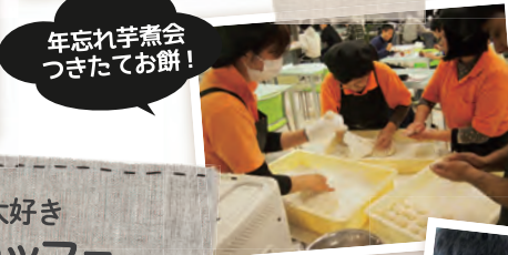
年忘れ芋煮会 つきたてお餅!