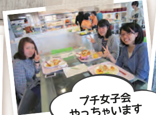
フ子女子会 やっちゃいます