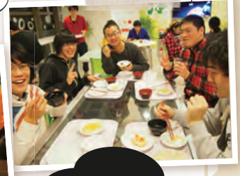
早くウィンナー 焼けないかな~